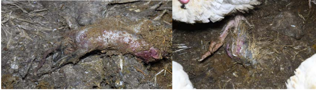
13. Kalkoenkwekerij 2. kadaver